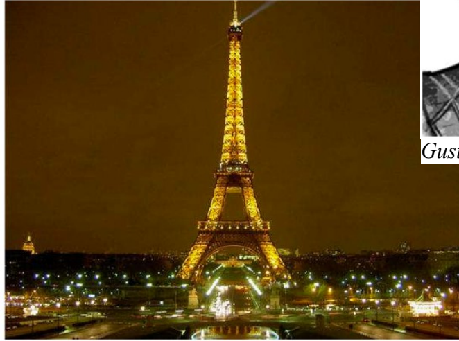
Tour Eiffel vue de nuit