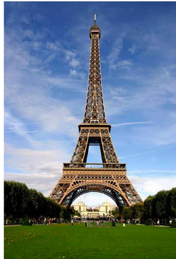
Tour Eiffel vue du Champ de Mars